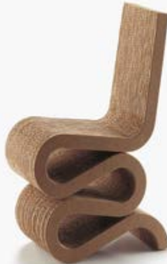
— Wiggle Side Chair, 1972 Frank O. Gehry

El Design Museum de Londres ha sido nombrado ganador del Premio al Museo Europeo del Año (Emya) 2018. En este contexto, el concurso tiene como objetivo reinterpretar un objeto cualquiera expuesto en el Design Museum de Londres. Para ello, el solicitante deberá actualizar el producto, desde el punto de vista del diseño, en base al contexto actual relacionado con la innovación tecnológica y la sostenibilidad medioambiental.