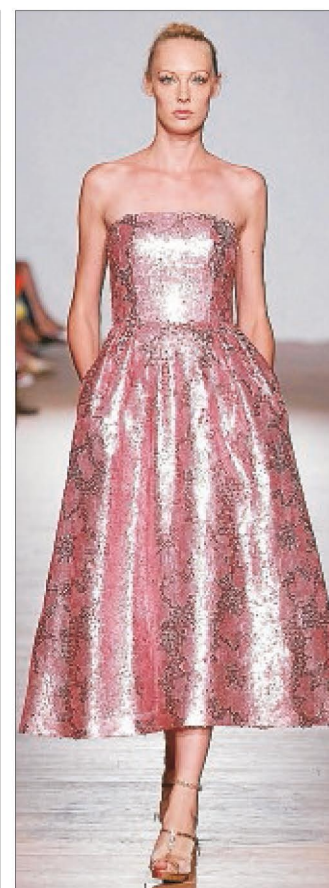
The 2nd Skin Co.

LA RAZÓN apoya la industria textil española celebrando su II Pasarela el 25 de marzo en el Teatro Caser Calderón, esta vez, con 12 diseñadores punteros dentro del sector